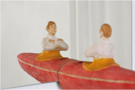
Johannes Hepp · 2018/19 · 25 x 23 x 20 cm

Die spiegelnde Oberfläche des Wassers diente schon immer zur Selbstbeobachtung bzw. geistigen Versenkung.