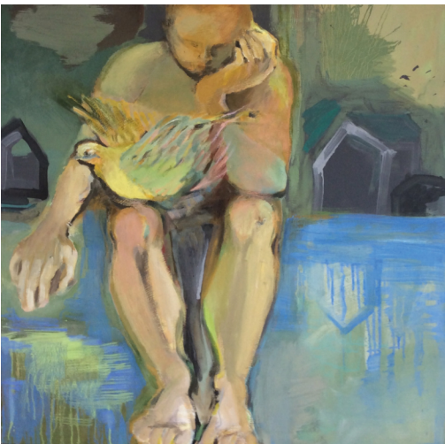
Antje Vega · 2008 · 90 x 90 cm

Dieses gestalterische Element findet sich auch im Werk von Antje Vega. Nur dass hier die Stimmung im Bild und die Gewichtung eine gänzlich andere ist.