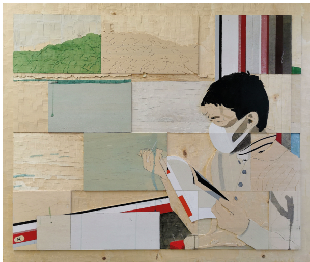
Detlef Waschkau · 2009 · 100 x 118 cm

Die Lautlosigkeit in diesen Fotografien ist auch in der Malerei bzw. den Reliefs von Detlef Waschkau zu finden. Seine besondere Technik, eine Art Druckstock für Holzschnitt – gegliedert in scheinbar verschiebbare Kacheln – als Malgrund einzusetzen, ist längst zum Markenzeichen des international agierenden Künstlers geworden.