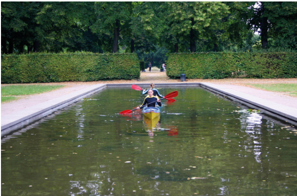
Iris Hoppe · 2018 · Detail (Video, 23:30 min.)

In einer anknüpfenden Situation befinden sich zwei Kajakfahrerinnen, die für das Video ‚Zielübung/target practice‘ in eine prekäre Lage gebracht werden.