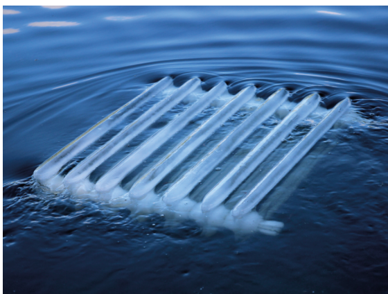
Rainer Jacob · 2016 · 60 x 80 cm

Kleinste Bewegungen im Wasser sind auch im Werk von Rainer Jacob Grundlage der Veränderung. Er formte einen Heizkörper in klassischer Form und 1:1 Größe aus Eis, setzte diesen im Flusswasser aus und dokumentierte den ‚Fortgang‘ fotografisch.