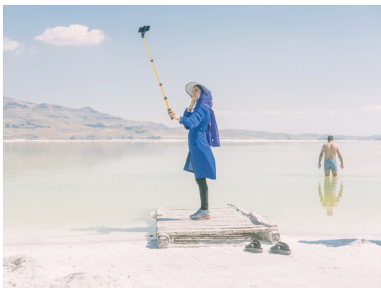
Maximilian Mann · 2018/19 · 60 x 80 cm

Noch vor 10 Jahren war der Urmia-See im Iran weltweit der zweitgrößte Salzsee. Durch eine extensive Landwirtschaft und durch den Klimawandel ist der See inzwischen um 80 % geschrumpft. Die dort gebliebenen Bewohner*innen mussten sich auf extreme Bedingungen mit heftigen Salzwinden und großer Hitze einlassen.