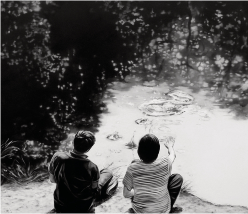
Joanna Jesse · 2018 · 60 x 70 cm

Zwei Jugendliche sitzen am Teich, der mit dichter Pflanzenwelt eine wunderschöne Idylle bietet. Die Faszination des Steinchenwerfens ins Wasser hat auch diese beiden Jugendlichen in den Bann gezogen. Die fast plastisch wirkende Wasseroberfläche mit den sich ausdehnenden Ringen scheint anstrengungslos greifbar zu sein. Die Hand ist hier wie schon im vorherigen Werk von Detlef Washkau die direkte Verbindung von Leben und Wasser.