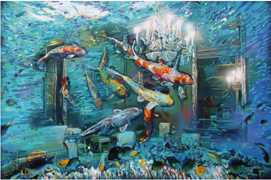
Marina Sailer · 2018 · 80 x 120 cm

alles lebt oder vergeht im Wasser. Kulturelle Errungenschaften verlieren ihren Halt und das Geschehen entzieht sich der Kontrolle des Menschen. Eine in der nahen Zukunft realistische Situation?